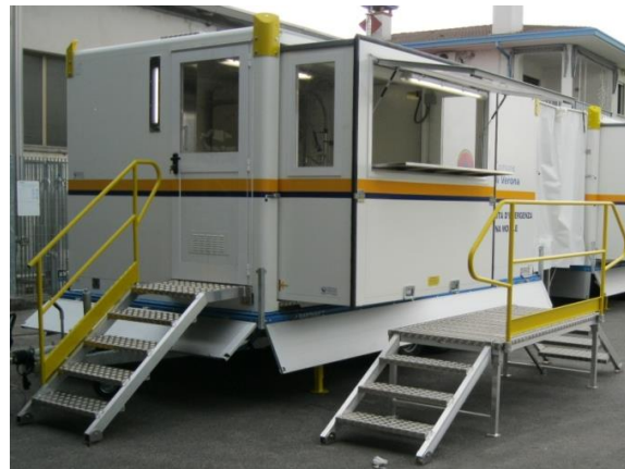
Vista su area ingresso lavaggi e corpo espandibile