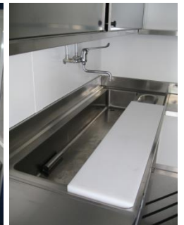
Immagini interne sugli attrezzamenti