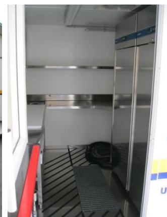
vista su ingresso area preparazione