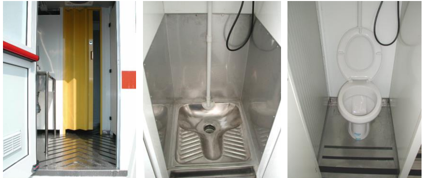
Innendetails: Eingang/Abzweigung - Kabine mit Stehtoilette - Kabine mit „Standard-Becken“