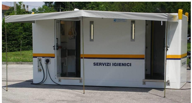
Ansicht des Komplexes mit Blick auf Seitenwand mit Eingängen, am Boden aufgestellt