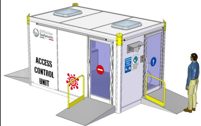
Ansicht auf AUSGANGSBEREICH FÜR UNBEFUGTES PERSONAL