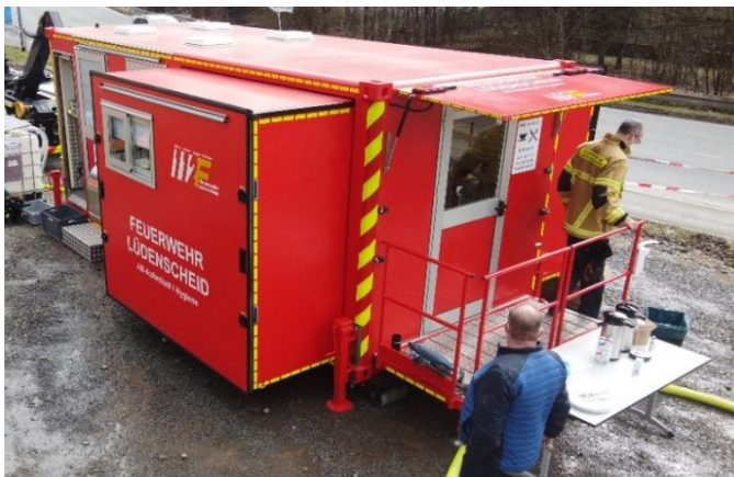
Blick auf den Eingang des Aufenthaltsraums – mit ausgezogenen Seitenkörper