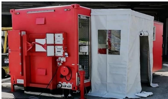
Vorderansicht auf Gerätefach und Vorzelte für WC und Umkleibereich