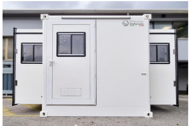
Ansicht in „erweiterter“ Betriebsposition